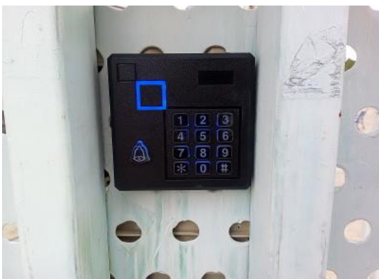
西側ゲートキーリーダー