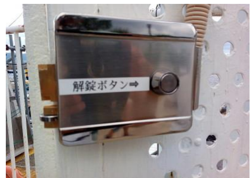
西側ゲート解錠ボタン