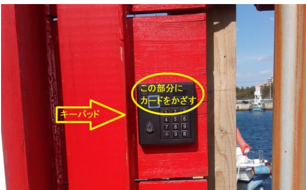
東側ゲートキーリーダー