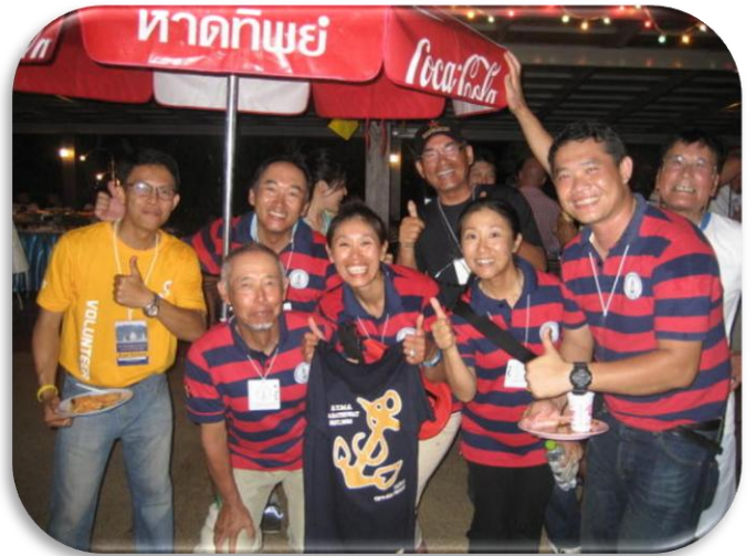
ライバルだったタイ海軍チームのクルーと・・・。

ライフラインもパルピット殆どなく、コックピットにはハイキング用のフットストラップもあるというデンギーみたいなレースボートです。本来はワンデザインクラスでのレースとなる予定でしたが、同じ型のボートが今回は 3 艇しかエントリーせず、IRC の 30~35 フィートクラスに編入されたため、最初から入賞の可能性は全く無くなりました。従って同じプラトウ 25 の残りの 2 艇(ロシア艇とタイ海軍艇)とのワンデザインスクラッチレースを想定してレースを楽しむこととなりました。