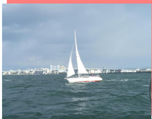
1月3日快走中のシーサー