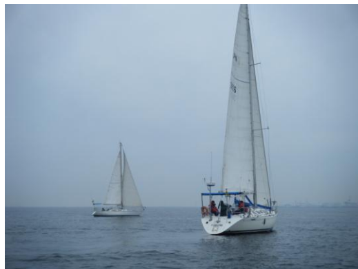
1月13日 微風帆走中のゆうばれと海鈴

*1月19日、今年初頭の合同委員長会により、各役員の活動予定とクラブ行事計画が出来ました！