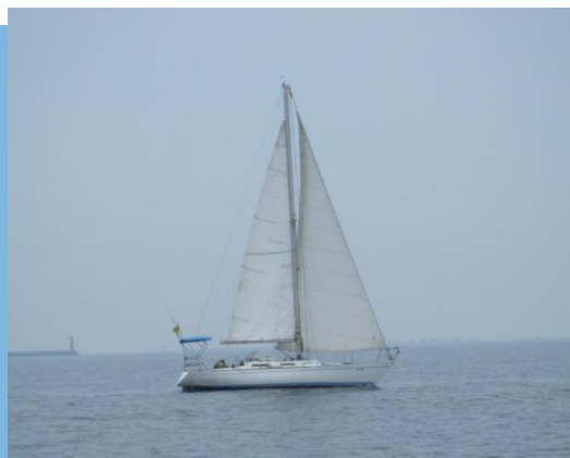
1月13日西宮沖の海鈴、曇り8℃・N2-5kt