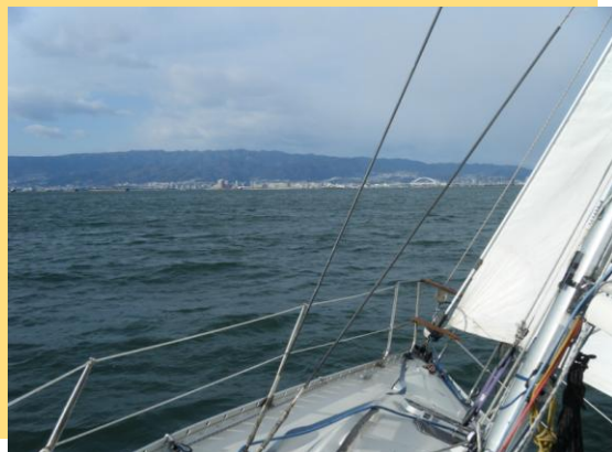
2013年1月3日西宮沖晴6℃・NW15-20kt(コントロールより)